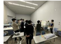
リトリート商品開発