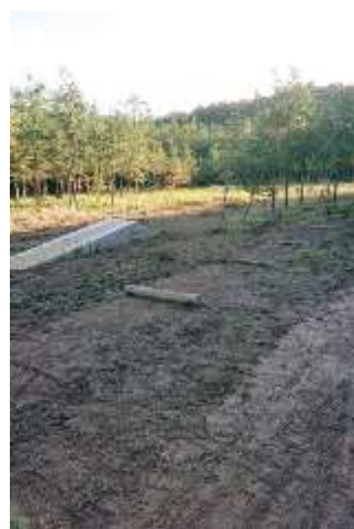
フォレストバイクコース