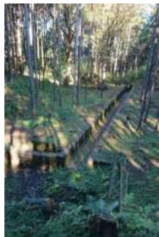
水力発電施設の遺構