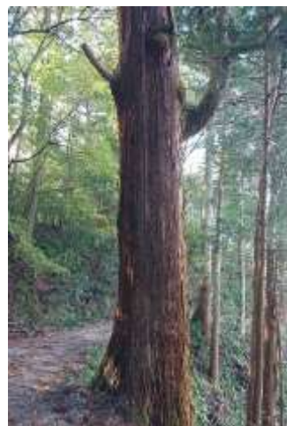
樹齢数百年のスギ