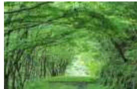
敷地内の森林散策路