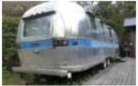
エアストリーム付コテージ／その内部