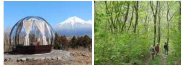
自然の中に滞在するため拠点として位置づけ。自然の中の散策路で静かに自分と向き合う。