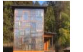
研修棟／研修スペース