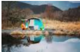
ヴィンテージテント