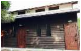
宿泊棟(メゾネット)