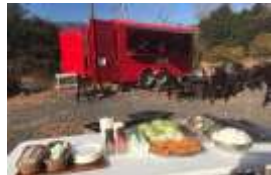
アウトドアエリア