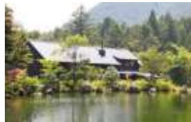
庭園に隣接する施設