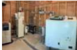
ハーブウォーター作成機