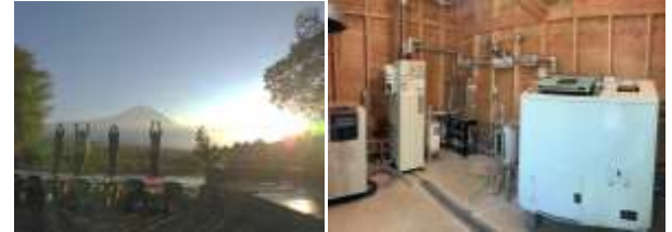
アロマセラピー、体質別薬膳茶、富士山を臨む環境でのヨガ等の多様なプログラムを提供。