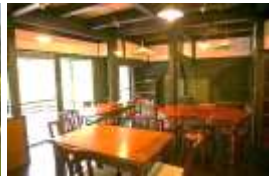
食堂・研修スペース