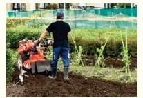
ユニバーサル農園の開設