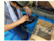
養殖籠補修・木工技術の習得