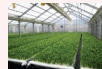
農業生産施設(水耕栽培ハウス)