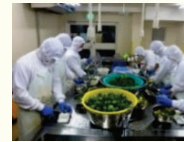
農産加工の実践研修