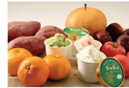
農林水産物を利用した新商品開発