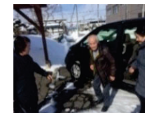
体制構築及び実証活動 （高齢者の移動確保）