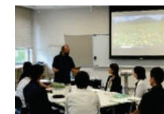
農村プロデューサー 養成講座の風景