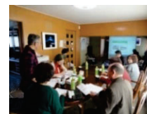
地域の活動計画の策定 （ワークショップの開催）