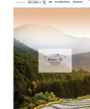
WebサイトやSNSによる 優良事例の情報発信