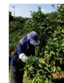
農山漁村の多様な活動への参加