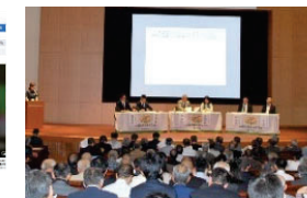
農業農村の多様な価値の理解醸成