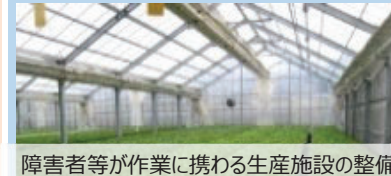
障害者等が作業に携わる生産施設の整備