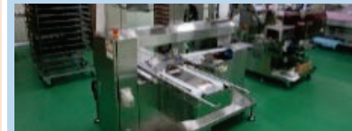
農林水産物処理加工施設の整備