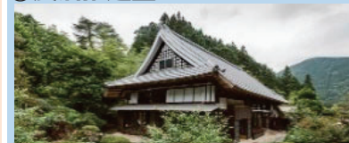
古民家等を活用した滞在型施設の整備