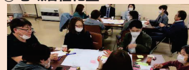
地域住民による地域活性化のための活動計画づくり