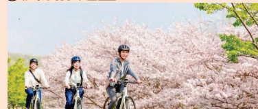
景観等を活用した観光コンテンツの開発