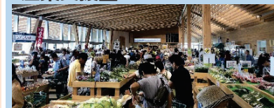
農林水産物直売所の整備