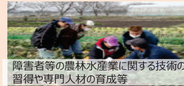
障害者等の農林水産業に関する技術の習得や専門人材の育成等