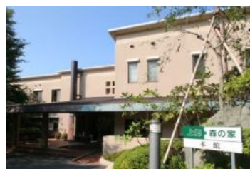
昭和の森フォレストビレッジ