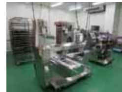
農林水産物処理加工施設