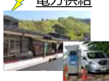
EV車等への給電設備