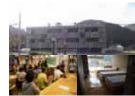
廃校を利用した交流施設