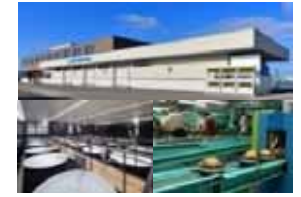
集出荷・貯蔵・加工施設