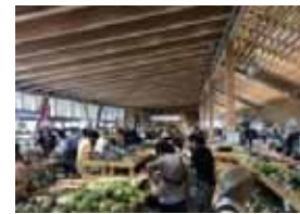
農林水産物直売所