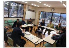
専門家の派遣・指導