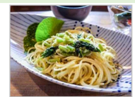
地元食材・景観等を活用した観光コンテンツの開発