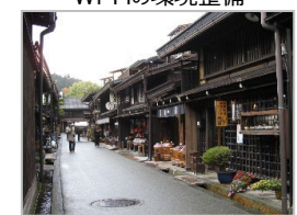
古民家等を活用した滞在施設の整備