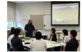
農村プロデューサー 養成講座の風景