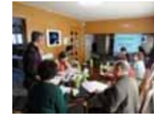
地域の活動計画の策定 （ワークショップの開催）

※条件不利地においては、交付期間の延長・上限額の加算措置あり。また、専門的スキルを活用する場合には、交付期間の延長・上限額の加算措置あり。