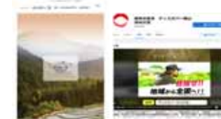
WebサイトやSNSによる 優良事例の情報発信