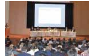
農業農村の多様な価値の理解醸成