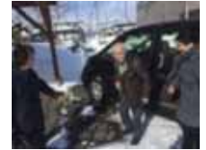
体制構築及び実証活動 （高齢者の移動確保）