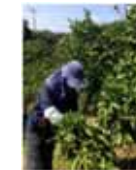
農山漁村の多様な活動への参加