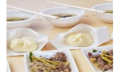
山菜を利用した商品開発