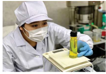
地域資源を活用した新商品開発