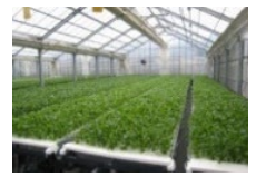
障害者等が作業に携わる生産施設の整備