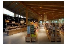
農林水産物加工・販売施設の整備