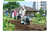
都市農地貸借による担い手づくりへの支援