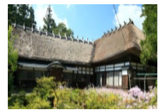
古民家等を活用した滞在型施設の整備