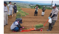
高収益作物の導入

収益力向上や販売力強化等に関する取組、複数の集落の機能を補完する農村RMOの形成、デジタル技術の導入・定着を推進する取組を支援します。