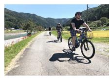
景観等を利用した高付加価値コンテンツの開発