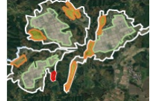
土地利用構想の作成