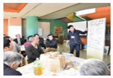
地域活性化のための活動計画づくり*