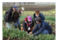
障害者等の農産物栽培技術の習得