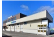
集出荷・貯蔵・加工施設の整備