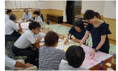
農村RMO形成に向けた取組