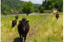
農地の粗放的利用